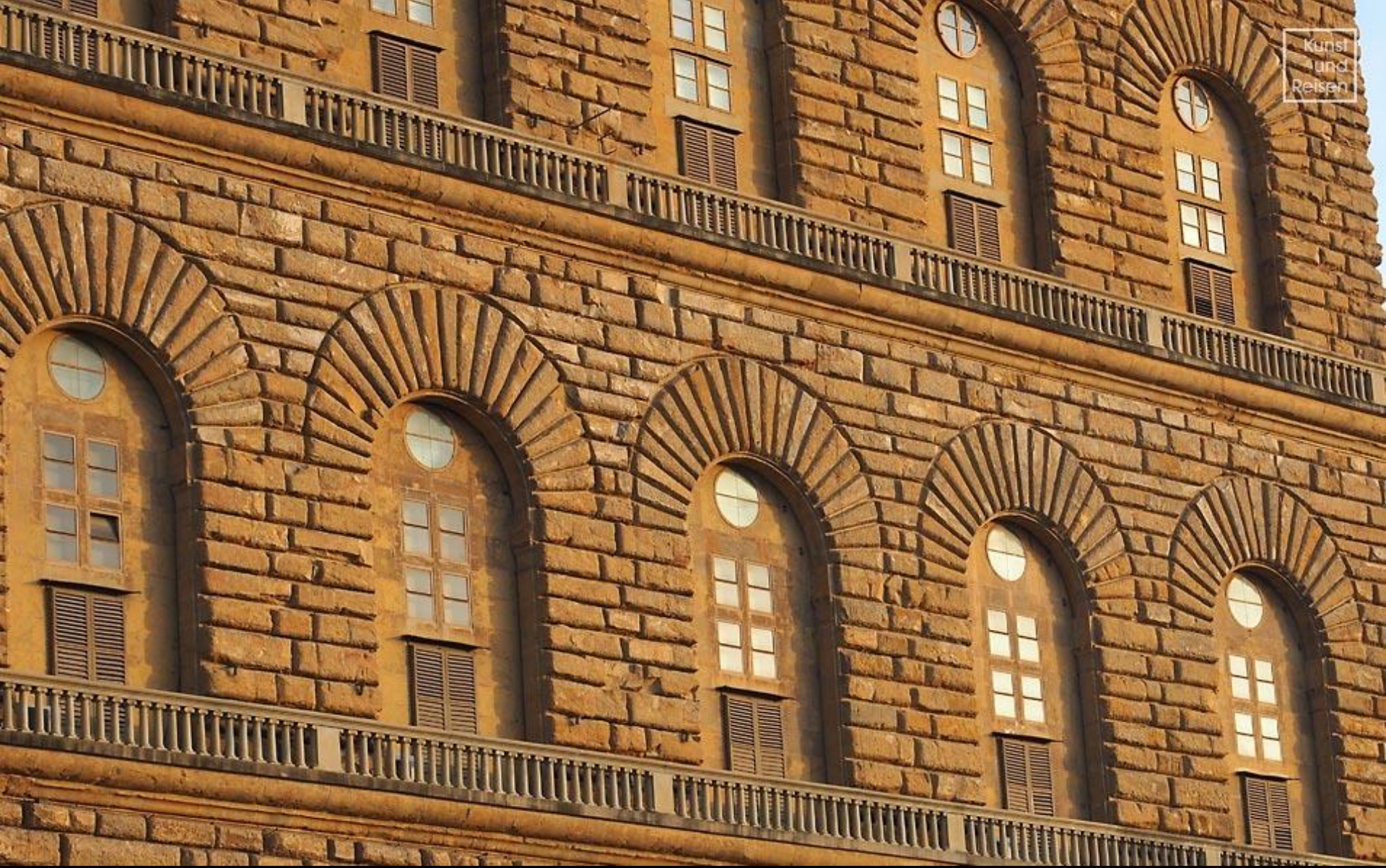
Rustikamauerwerk am Palazzo Pitti, Florenz - Toskana