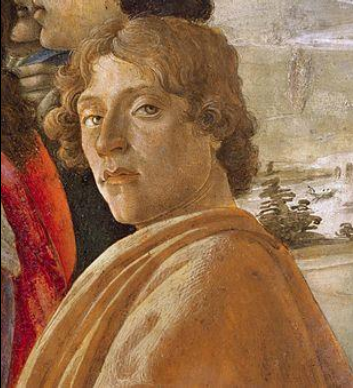
Sandro di Mariano di Vanni Filipepi