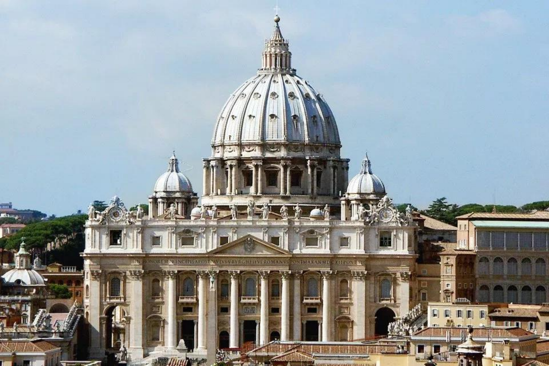
Petersdom in Rom