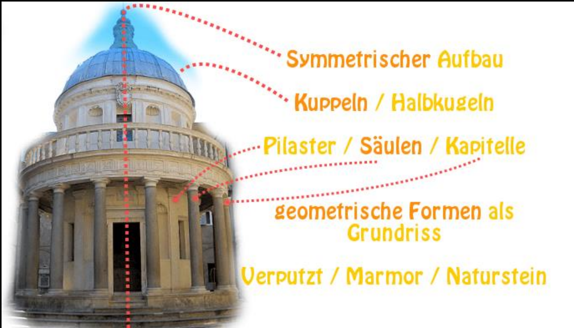
Typische Stilelemente von Sakralbauten in der Renaissance