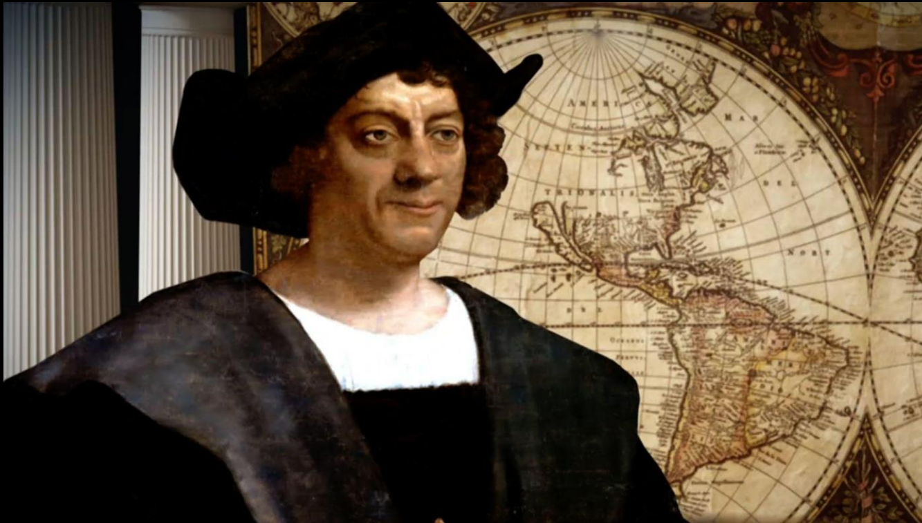
Christoph Kolumbus (1451 - 1506)

Die Renaissance ist auch das Zeitalter der Entdeckungsreisen und der Kolonisierung der „Neuen Welt“.