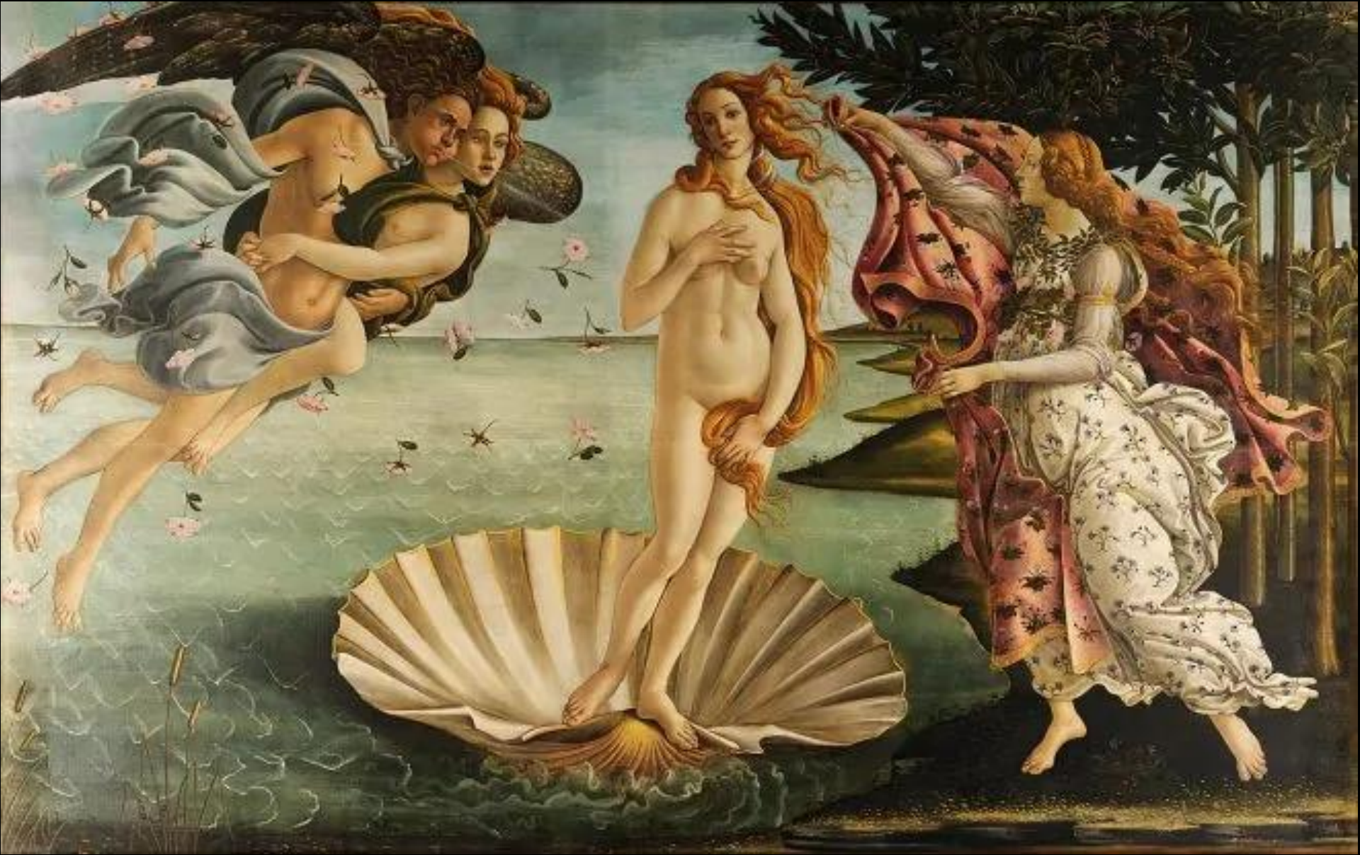
Die Geburt der Venus, um 1486