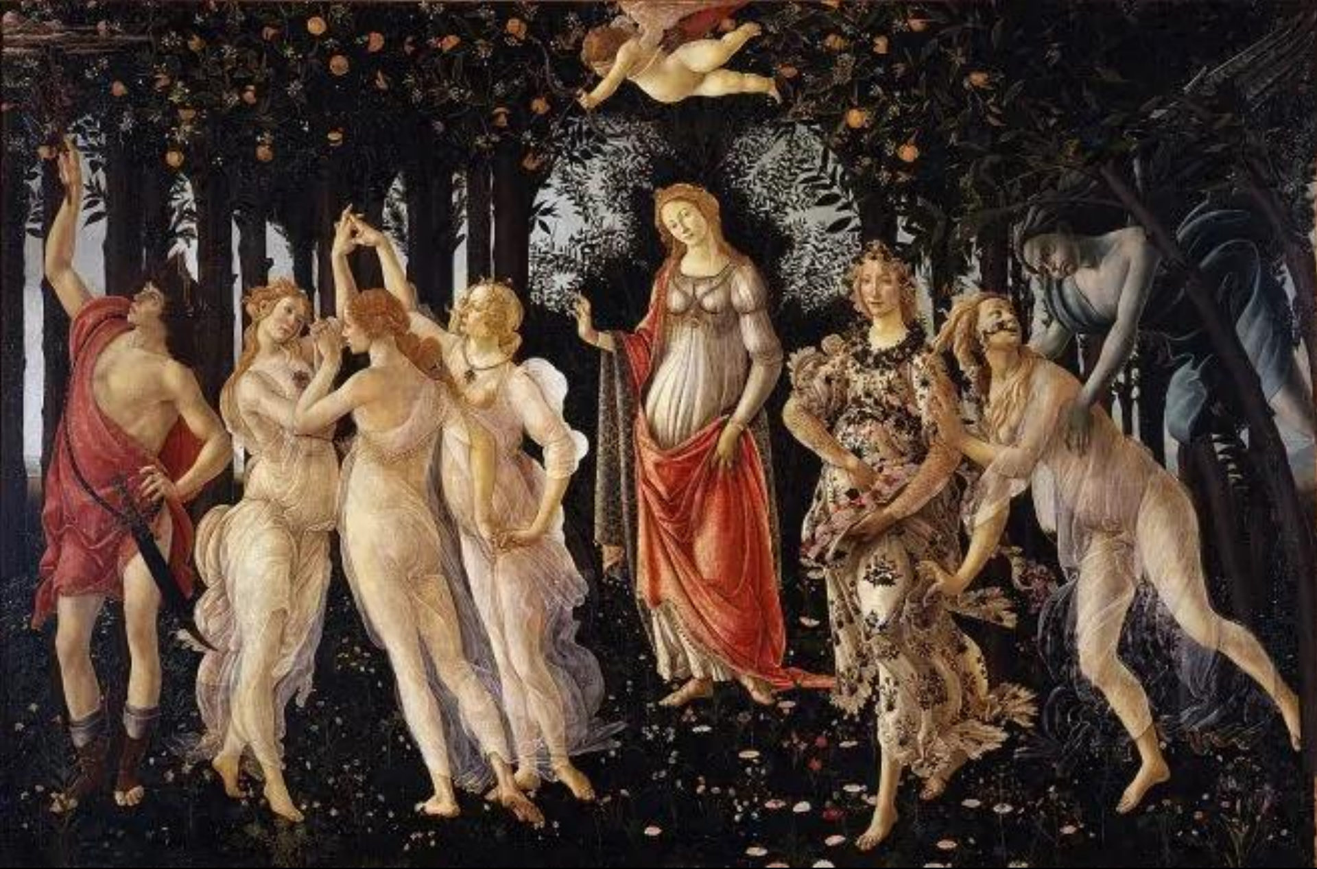
Primavera - Ende 1470er - Anfang 1480er