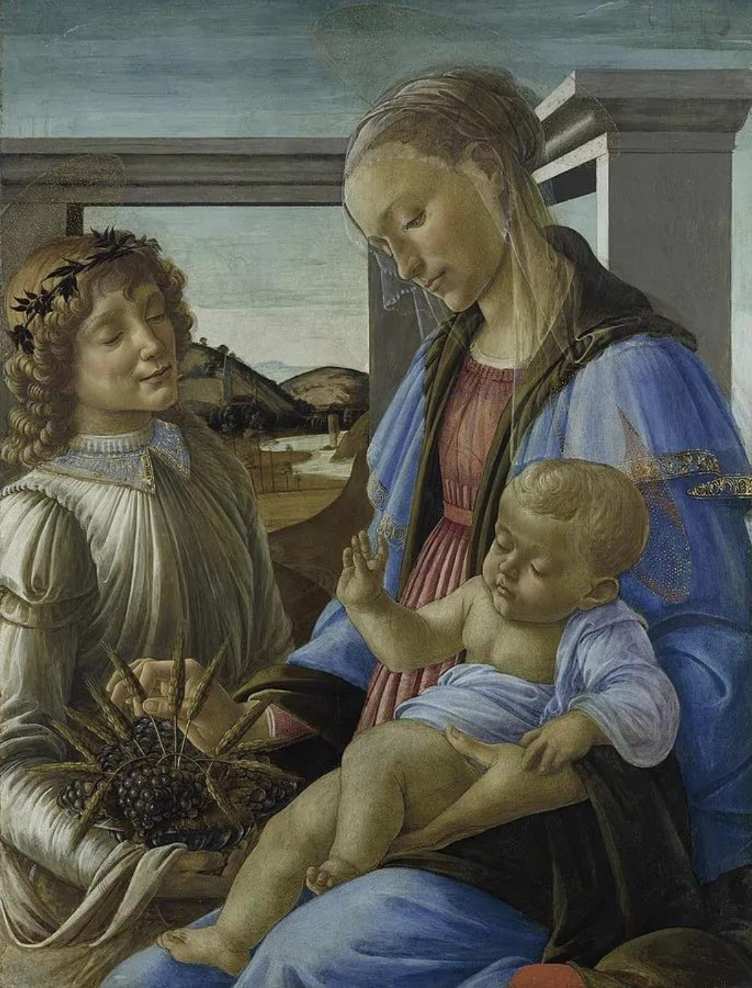
Madonna mit Kind und Engel, 1470